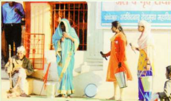
महाविद्यालयाद्वारे आयोजित रा.तु.म.नागपूर विद्यापीठ राष्ट्रीय सेवा योजना विद्यापीठस्तरीय शिबीरामध्ये पथनाट्याद्वारे पाणी बचतीवर जनजागृती करताना शिबीरार्थी