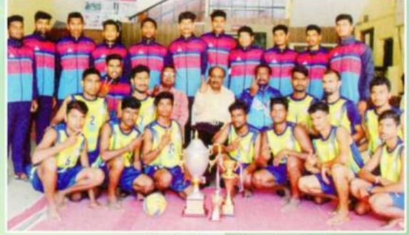
रा.तु.म.नागपूर विद्यापीठ आंतर महाविद्यालयीन स्पर्धेमध्ये महाविद्यालयाचा व्हॉलीबॉल व खो-खो विजयी संघ