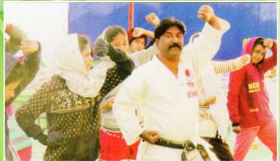
महाविद्यालयाद्वारे आयोजित रा.तु.म.नागपूर विद्यापीठ राष्ट्रीय सेवा योजना विद्यापीठस्तरीय शिबीरामध्ये स्वयंमिद्वारा प्रशिक्षणाचे धडे घेताना शिबीरार्थी