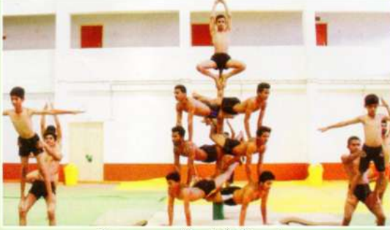
महाविद्यालयाद्वारा आयोजित खेले इंडिया राष्ट्रीय स्तर मल्लखांब प्रात्यक्षिक सादर करताना प्रशिक्षणार्थी