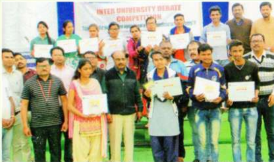
महाविद्यालयाद्वारे आयोजित आंतरविद्यापीठ वादविवाद स्पर्धेतील संपूर्ण स्पर्धक