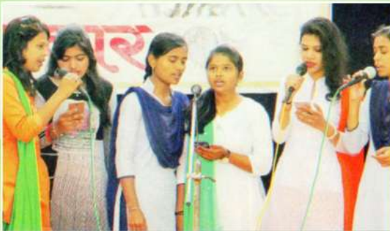
२६ जानेवारी प्रजासत्ताक दिनानिमित्त संगीत विभागाद्वारा आयोजित देशभक्तीपर समुहगीत सादर करतांना विद्यार्थिनी