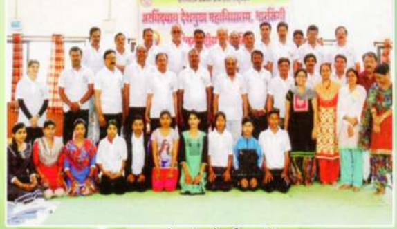
२१ जून आंतरराष्ट्रीय योगा दिन प्रसंगी महाविद्यालयाचे कर्मचारी व विद्यार्थी