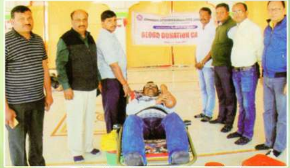
महाविद्यालयाद्वारे आयोजित रा.तु.म.नागपूर विद्यापीठ राष्ट्रीय सेवा योजना विद्यापीठस्तरीय शिबीरामध्ये रक्तदान करताना विद्यार्थी