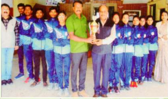
रा.तु.म.नागपूर विद्यापीठ आंतरमहाविद्यालयीन योगा स्पर्धेत महाविद्यालयाचा विजयी महिला व पुरुष संघ