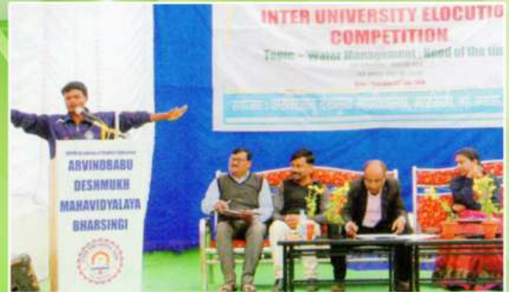
महाविद्यालयाद्वारा आयोजित आंतरविद्यापीठ परिसंवाद स्पर्धेत मनोगत व्यक्त करतांना स्पर्धक