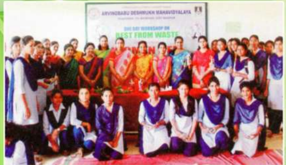
महाविद्यालयाच्या युमन्स मेल द्वारे आयोजित कचऱ्यातून कला कार्यशाळेत पारिदर्शक, प्राध्यापक व विद्यार्थी