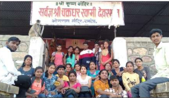
महाविद्यालयाच्या मानव्यशास्त्र विभागातर्फे आयोजित एक दिवसीय अभ्यास दौऱ्या निमित्त श्री. चक्रधर स्वामी देवस्थान, रामटेकला भेट