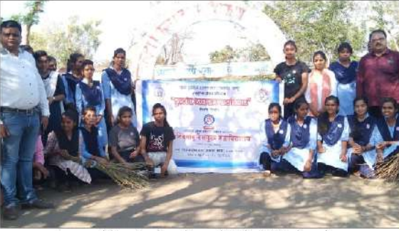
इंदरवाडा येथे राष्ट्रीय सेवा योजनेद्वारे विशेष शिबीराचे आयोजन