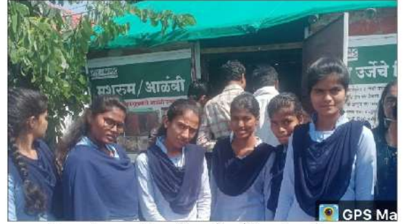
महाविद्यालयातील वनस्पतीशास्त्र विभागाद्वारे आयोजित अभ्यास दौऱ्या दरम्यान DAESI कळमेवर येथे विद्यार्थ्यांची आळंबी उत्पादन युनिटला भेट