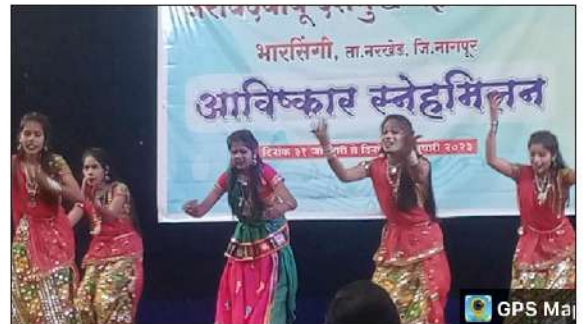
महाविद्यालयीन सांस्कृतिक समितीतर्फे आयोजित 'अविष्कार स्नेहमिलन' कार्यक्रमाप्रसंगी नृत्य सादर करताना महाविद्यालयीन विद्यार्थीनी