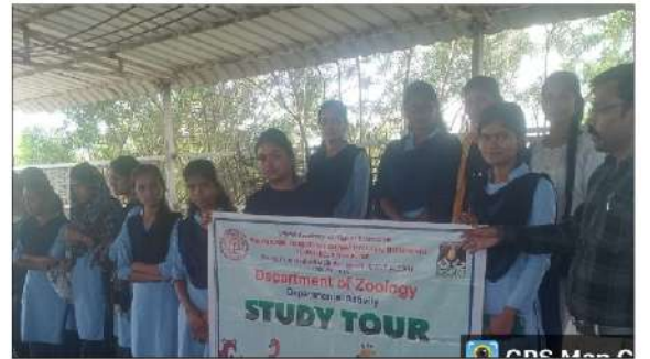
महाविद्यालयातील प्राणीशास्त्र विभागाद्वारे आयोजित अभ्यास दौऱ्या दरम्यान DAESI कळमेवर येथे विद्यार्थ्यांची गंडुळ खत निर्माती प्रकल्पला भेट