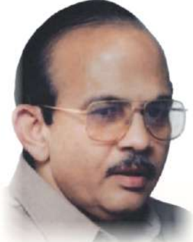
Hon'ble Shri. Ranjeelbabu Deshmukh President VSPM Academy of Higher Education Nagpur