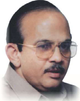
Hon'ble Shri. Ranjeetbabu Deshmukh President VSPM Academy of Higher Education Nagpur